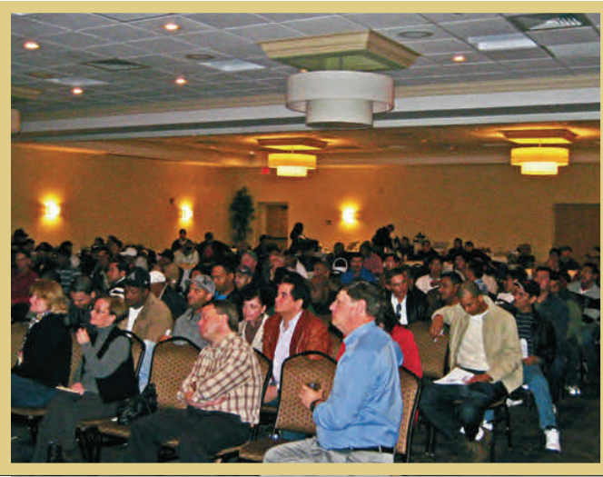
Seminario de Beneficios en Woburn, MA

¿Te das cuenta de que por cada hora que trabajas, un promedio de $17.22 es contribuido a sus Fondos de Pensión, Salud y Bienestar y al de Annuity? ¿No debería tomar el tiempo para aprender a utilizar mejor estos beneficios para usted y su familia? La Oficina del Fondo ha programado una serie de seminarios educativos para ayudarle a usted y su cónyuge a comprender los beneficios que usted tiene en los Fondos de Pensión, Salud y Bienestar y Annuity. Cubriremos temas acerca de su deducible, los copagos, pre-autorización para determinados procedimientos, como leer un EOB que tantos de ustedes reciben en el correo.