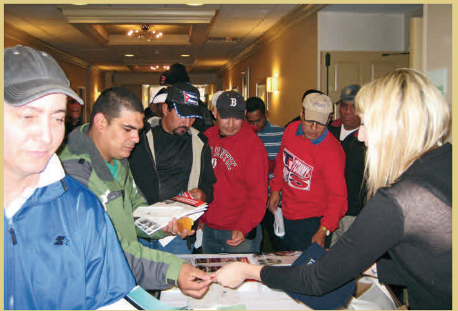
Trabajadores registrándose para un Seminario organizado en Woburn el año pasado

A menos que un acuerdo de última hora entre Express Scripts y Walgreens, a partir del 1 de enero de 2012, ya no podrá usar su tarjeta de Express Scripts del Fondo de los Trabajadores de Massachusetts. Si usted continua usando Walgreens para surtir su receta(s), usted tendrá que pagar por su receta(s) y presentar un formulario de solicitud de reembolso a Express Scripts. Express Scripts le reembolsara a su costo máximo permitido, menos el copago. Es muy probable que el costo máximo permitido sea menor de lo que pago en Walgreens, dando como resultado un costo más caro para usted.